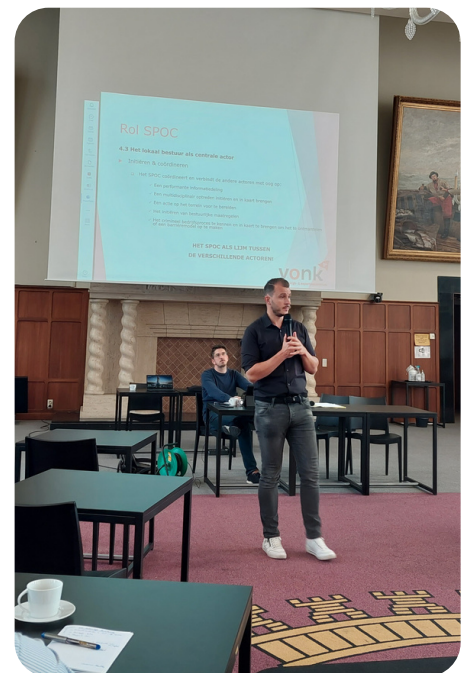
awareness sessie stad Blankenberge

Wenst u binnen uw bestuur een awareness sessie te laten doorgaan op maat van uw stad of gemeente dan kan u hiervoor steeds terecht bij Vonk.